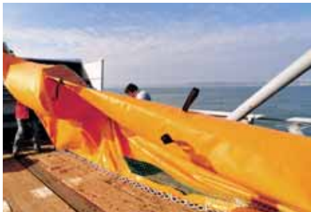
Desconexión del último flotador de la bobina. Unhooking of the last float.