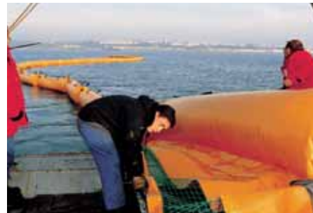
Puesta en Marcha Putting into the sea