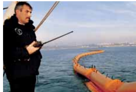
La implementación de la pesca de arrastre. Preparation for trawling.