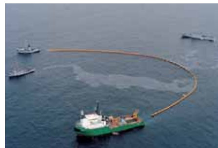
Captura de contaminantes. Capture of the pollutants.