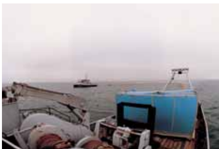
La pesca de arrastre. Trawling.