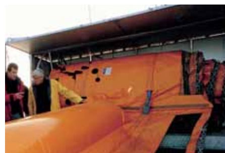
Enrollado de la barrera. Rolling of the boom.