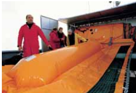
Inflación de Flotadores Inflation of the floats