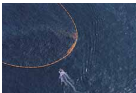
Contaminantes en la parte posterior de la bolsa. Pollutants in the back of the pocket.