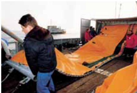
Preparación para el desenrollado de la barrera. Boom unrolling preparation.