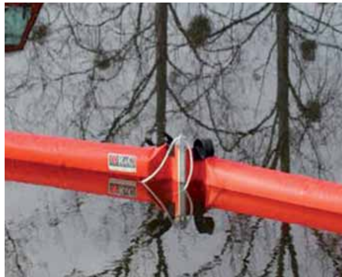
PLAYA BOOM GOELAND BASADO EN ESPUMA REDONDA BEACH BOOM based on Goeland with round foam

El uso de espuma evita la operación de inflado y desinflado durante la instalación o almacenamiento.