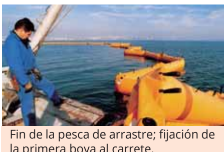
Fin de la pesca de arrastre; fijación de la primera boya al carrete. End of the trawling hooking of the first float to the roller.