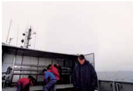
Vista del carrete de contenedores. View of the containerised roller.