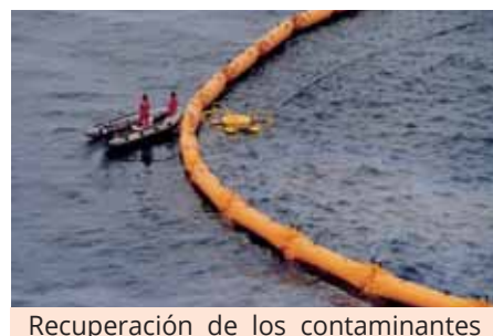
Recuperación de los contaminantes por un skimmer. Pollutants Recovery by a skimmer.