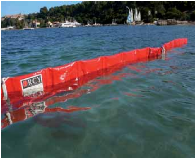
PLAYA BOOM BARRACUDA BASADO EN ESPUMA PLANA BEACH BOOM based on Barracuda with flat foam