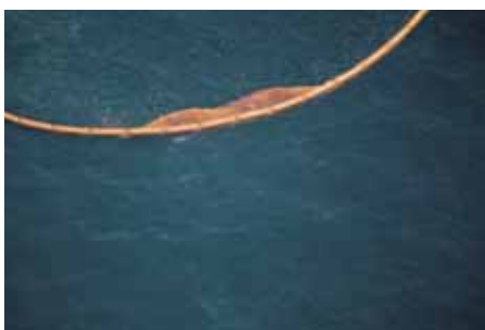
Contaminantes en la parte posterior de la bolsa. Pollutants in the back of the pocket.