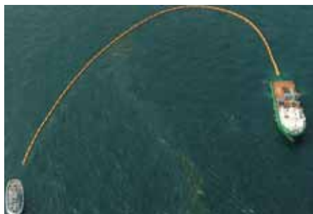
Vista aérea de la pesca de arrastre Aerial view of trawling.